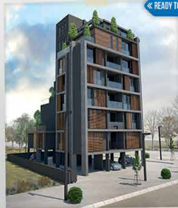
UNIQUE - FAMAGUSTA