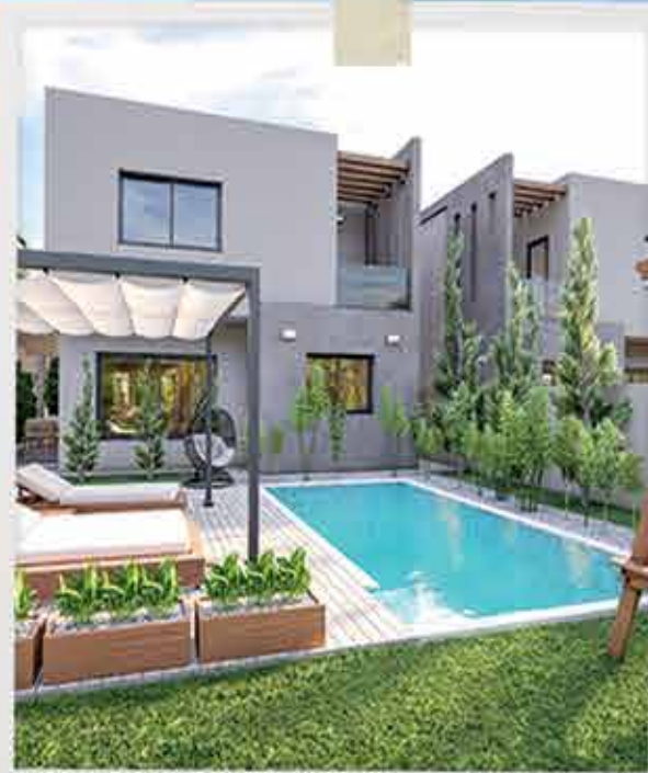
SERENITY HOMES - ÖTÜKEN