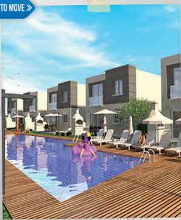
DREAM LIFE - KARPASIA