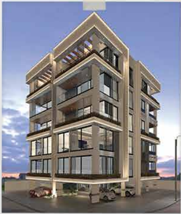
VOLNA - LONG BEACH